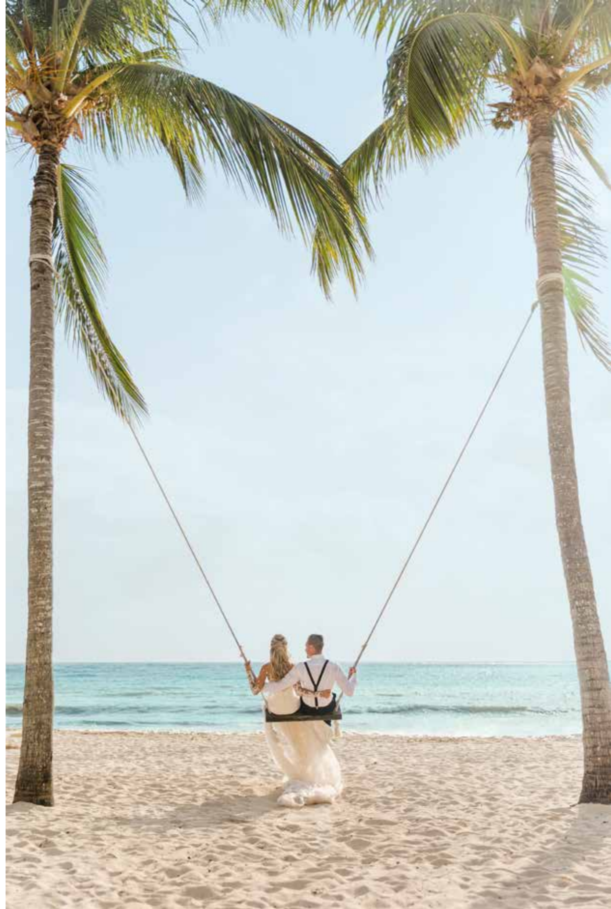
EN IBEROSTAR NOS TOMAMOS EN SERIO PENSAR EN GRANDE PARA QUE NUESTRAS PROPUESTAS IRRADIEN INSPIRACIÓN